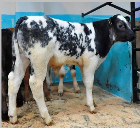
BBB X Holstein