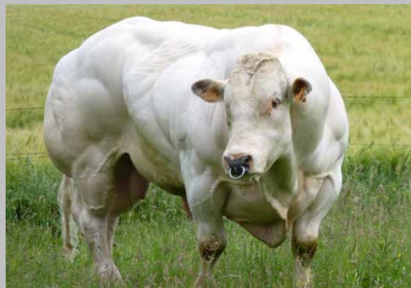
Su padre: Obligeant de la ganadería B. Cassart