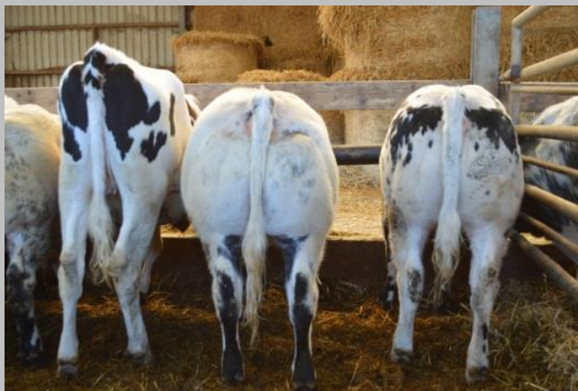
De izquierda a derecha: Holstein, BBB, BBB X Holstein.