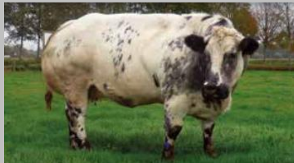
Su madre: Delta van de Schoolhoeve (Bélgica)