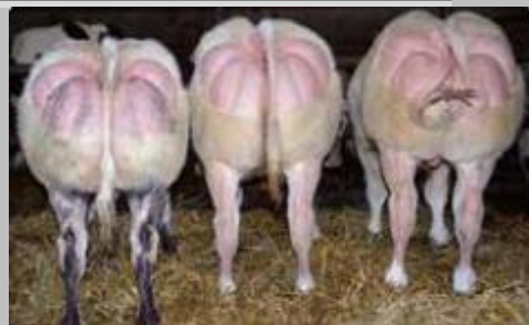
Hijos de Warrior en la ganadería Pieron Demarche (Sovet-Bélgica)