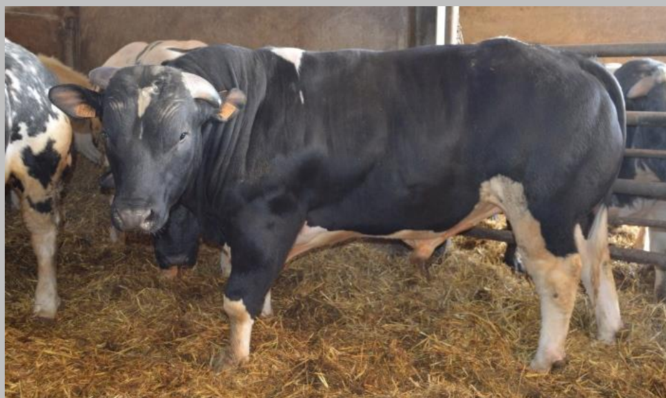
Tenero Azul Belga X Holstein de 15 meses (Ferme Saudoyer – Merbes Ste Marie – Bélgica)