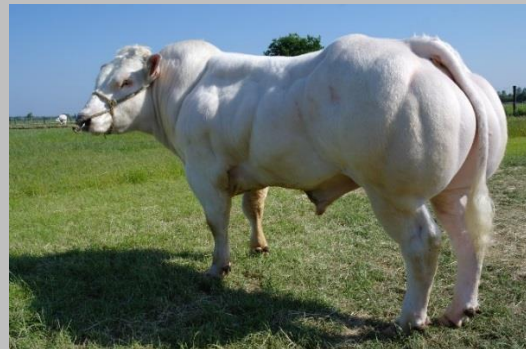
Lapsus de la Haie Madame