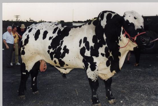
Aladin (BBB X Nelore) 1.240 kg com 39 meses

Resultados de la disección de la 7ª costilla derecha en la canal de terneros Braford y BBB x Nelore en Agribahia, Lagoa do Morro, Bahia, Brazil.