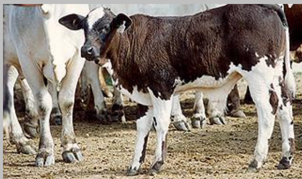
Becerros BBB X Nelore (Source Leroy et Coll: 1998 – 2001)